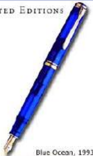
Blue Ocean, 1993