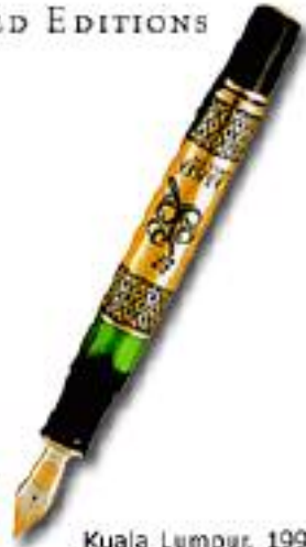
Kuala Lumpur, 1998